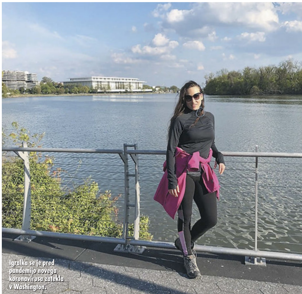
Igralka se je pred pandemijo novega koronavirusa zatekla v Washington.

Ja, čeprav sem na varnem in zdrava, situacija še zdaleč ni prijetna. Čutim veliko negotovosti glede prihodnosti, kar je še večji izziv za nas, ki imamo delovne vizume za svobodne umetnike v tujini. Predvidevamo, da si New York še dolgo ne bo opomogel. Tudi naša panoga bo nekaj časa kar trpela – gledališče in performativna umetnost morda bolj kot film in TV – ampak omejitve druženja v večjih skupinah ljudi bodo nekaj časa neizogibne in ovira za vsa igralska področja. Veliko projektov je padlo v vodo in ne vemo, kdaj in koliko bomo lahko spet delali. Ta strah moramo čim hitreje in vsi skupaj izkoristiti za iskanje novih oblik in možnosti za preživetje naše branže in s tem nas samih.